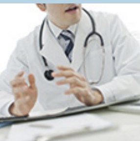
Table ronde sur l'activité physique et la nutrition sous l'angle de deux thématiques :